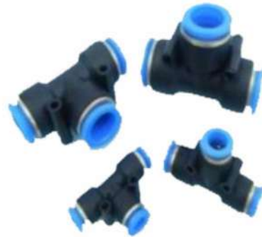
Union Conectora para Poliamida (TEE - Tubo - Tubo) Modelo PE