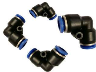
Union Conectora para Poliamida (Angulo 90°) Modelo PV