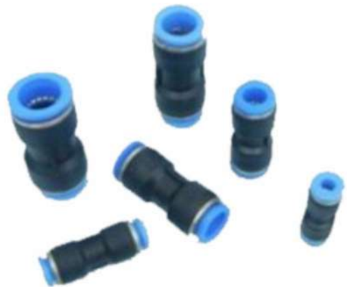
Union Conectora para Poliamida (Tubo - Tubo) Modelo PU